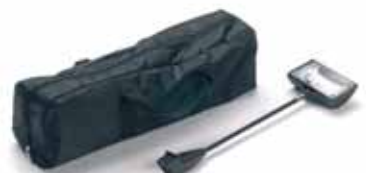
Zubehör: Beleuchtung inkl. Tasche

Material: eloxiertes Aluminiumgehäuse Grafikpaneel: 150 x 218 cm Gewicht: ca. 10 kg Grafikverfahren: Solvent-Digitaldruck auf Bannermaterial, UV-beständig